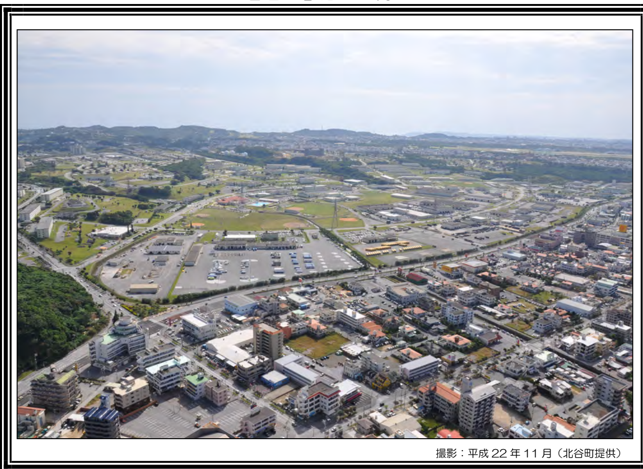
撮影：平成 22 年 11 月（北谷町提供）